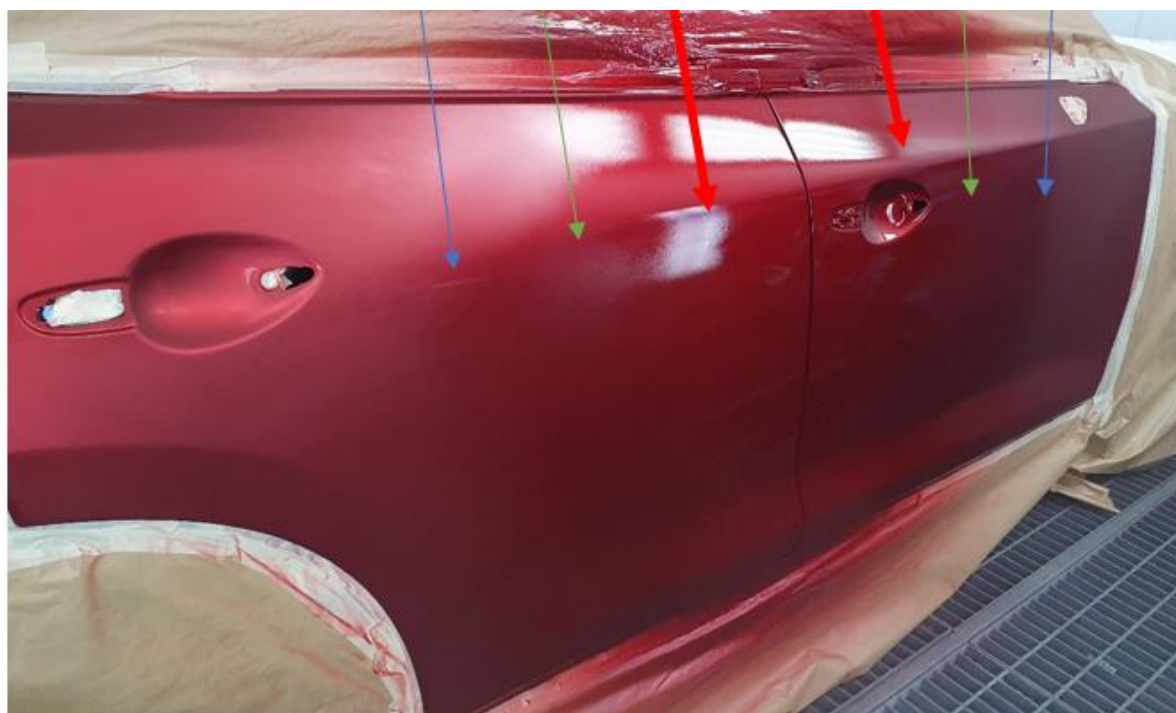
Третий слой тонированного бесцветного лака