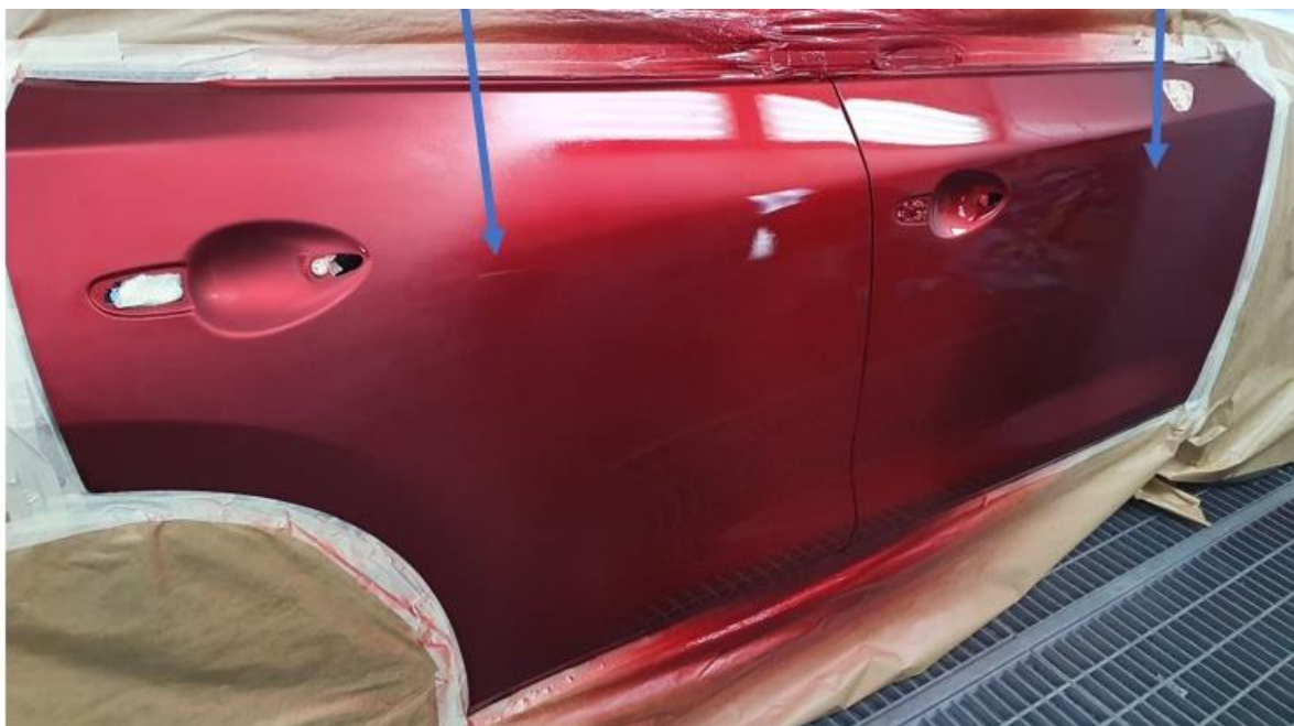
Первый слой тонированного бесцветного лака