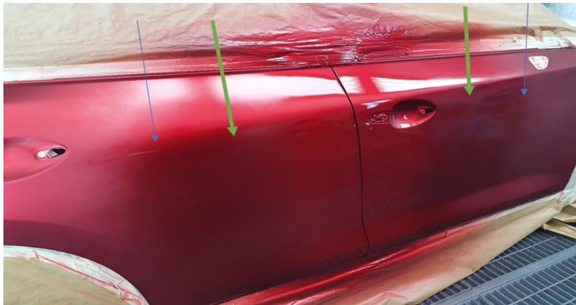
Второй слой тонированного бесцветного лака