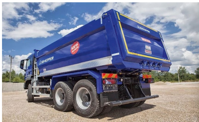
↑ Jeden z produktów KH-KIPPER pomalowany lakierami NOVOL.